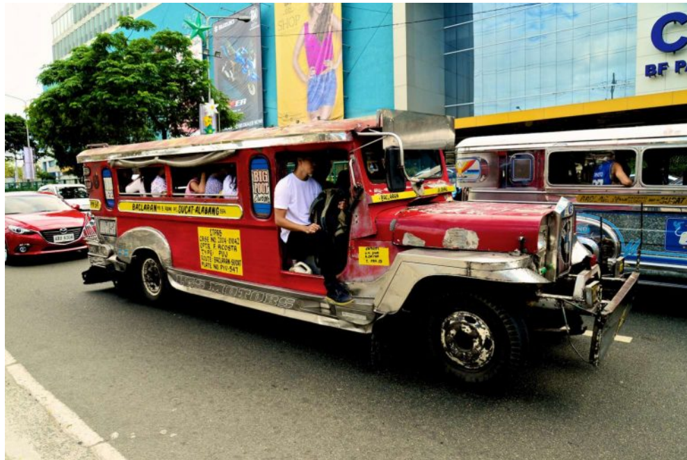
Jeepney di Manila