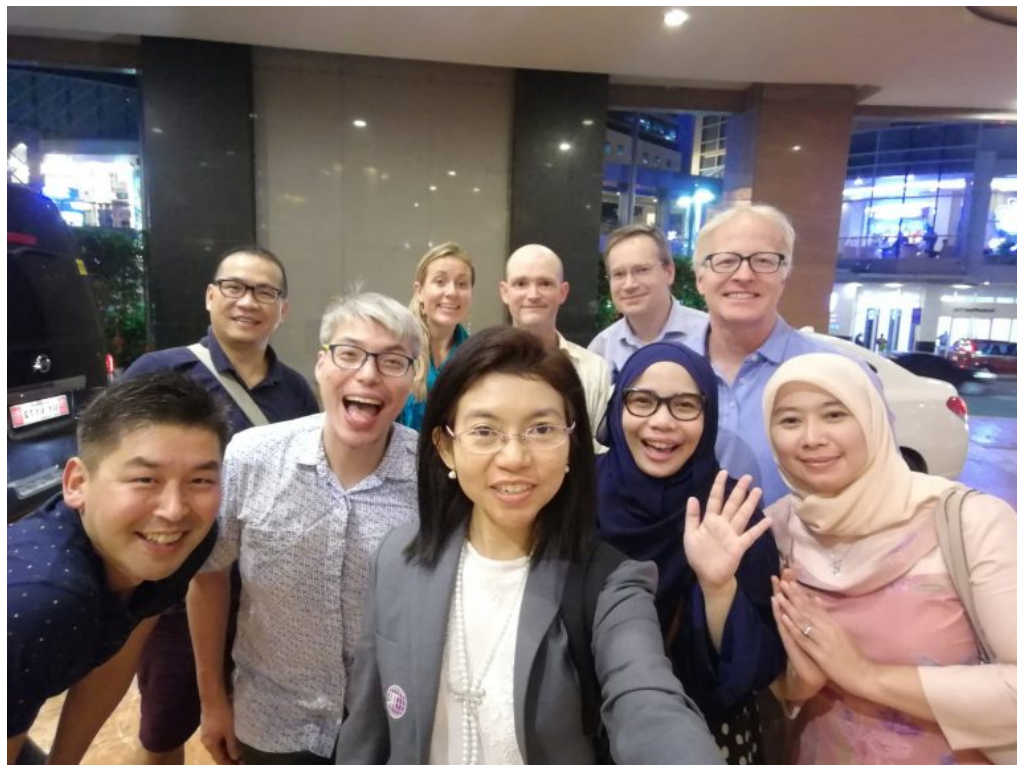
Foto Bersama Para Pembicara Utama dan Pemakalah