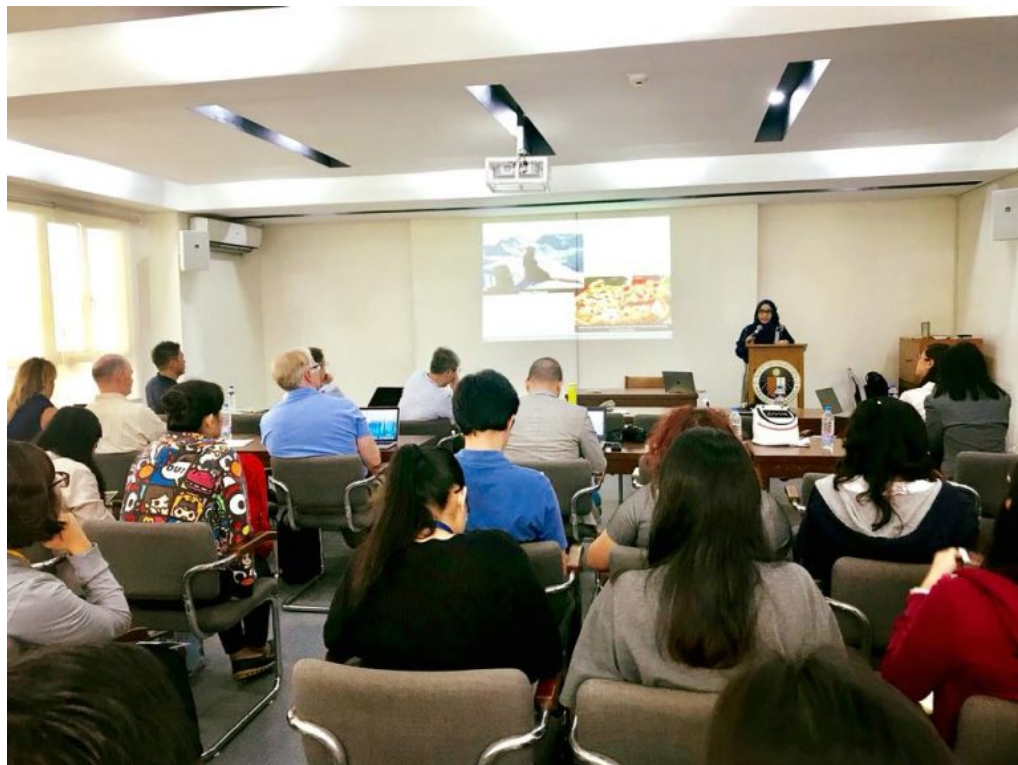
Saat presentasi di Ateneo de Manila University

Saya memberikan presentasi berjudul Indonesian Netizen Perception on Halal Tourism and Sharia Tourism . Wisata berkonsep halal merupakan tren terbaru dari industri pariwisata dunia mengingat saat ini sudah ada 106 juta muslim yang melakukan perjalanan liburan (Husain, 2015). Pangsa pasar senilai 145 milyar dollar Amerika ini mencakup 10% dari seluruh bisnis wisata dunia. Sebuah jumlah yang patut diberikan perhatian lebih lanjut.